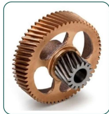
Engrenagem Intermed. de Bronze - MBI-10/22